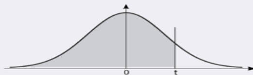
Table donnant P(Z < t) pour une variable aléatoire suivant N(0,1)